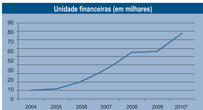
Evolução do financiamento no Sistema Brasileiro de Poupança e Empréstimo no primeiro trimestre de cada ano

Observa-se a evolução do financiamento no Sistema Brasileiro de Poupança e Empréstimo no primeiro trimestre de cada ano, onde se pode avaliar o crescimento do setor imobiliário no Brasil: